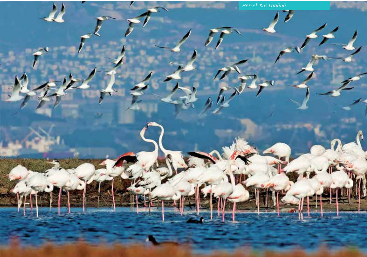
Hersek Kuş Lagünü

liği'nde zirai alanda yapılan modern tekniklerin kullanılması ve çevre üreticilere örnek olması için nitelikli fide, fidan, damızlık hayvan ihtiyacını karşılanması anlamında yapılan çalışmaları yakından izlemek ve dinlenmek için kullandığı köşktür. Köşkün yapıma hikâyesi Atatürk, 21 Ağustos 1929 tarihinde İstan-