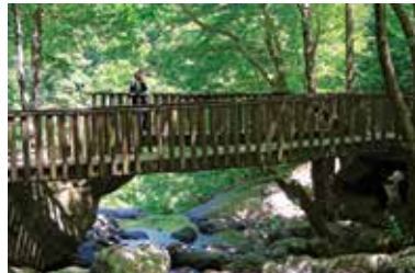
Erikli Yaylası ve Kent Ormanı