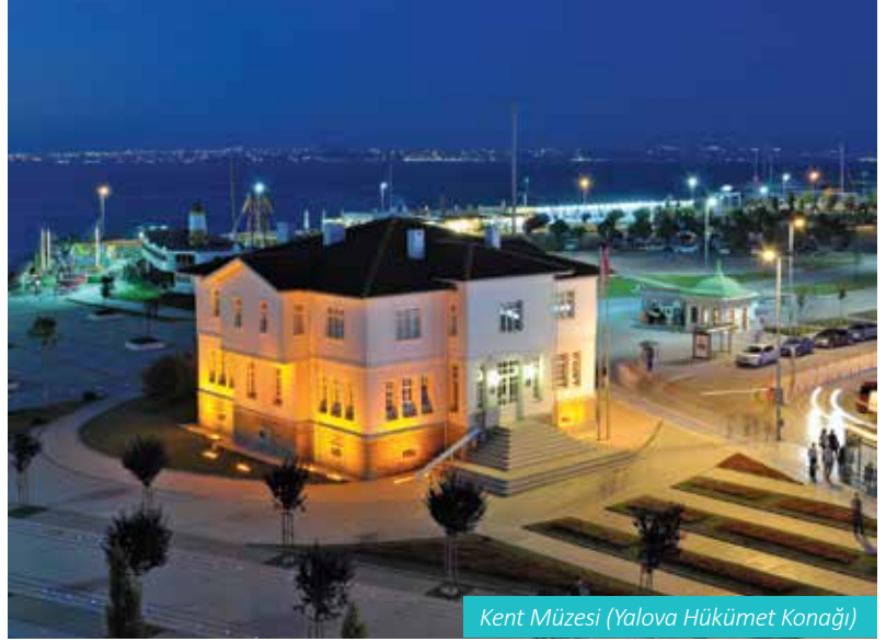
Kent Müzesi (Yalova Hükümet Konağı)

daimi sergi salonu olarak hazırlanan üst katta ise çeşitli kültürel etkinlikler ve sergiler düzenlenmektedir. Binanın tarihi hükümet konağı vazifesini tamamlamıştır belki ama şehrin merkezinde önemli bir kültür merkezi olarak hizmetini sürdürmektedir.