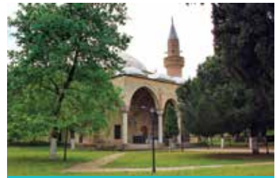
Hersekzade Ahmet Paşa Camii