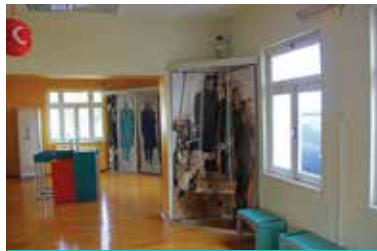
TİGEM Atatürk Köşkü ve Çocuk Müzesi

Yapı erken Bizans dönemine ait olup, sonradan çift narteks ve apsis eklenmiştir. Haç planlı mekâna oldukça geniş bir kapıdan girilir. Haçın kolları beşik tonozla örtülmüştür. Orta mekânda, 8 penceresi bulunan yüksekçe kasnaklı bir kubbe bulunmaktadır. Kilise, serbest haç planının değişik bir örneğidir. Kara Kilise'nin İ.S.6'cı yy.'da hamam, 8–9 uncu yy.'da kilise olarak kullanıldığı ileri sürülmektedir. Yine bazı kaynaklarda; Kara Kilise'nin, Roma dönemine ait bir su mimarisi olduğu, Bizans döneminde kilise haline getirildiği belirtilmektedir. Kara Kilise