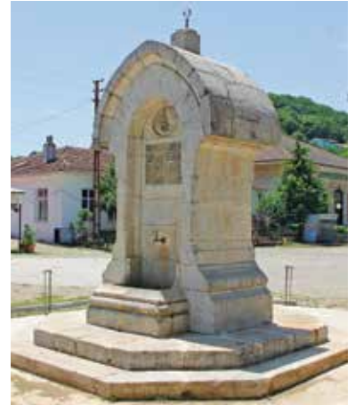
Mehmed Reşad Han Çeşmesi