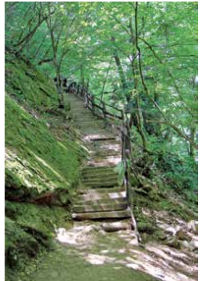
Erikli Yaylası ve Kent Ormanı