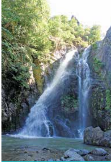
Erikli Çifte Şelâle

Doğa tutkunlarının rahat ve doğal bir yürüyüş parkuru olup, yaz aylarında yerli ve yabancı turistlerce yoğun olarak tercih edilmektedir. Bu güzergâh daha çok foto safari, doğa yürüyüşü ve piknik alanı olarak kullanılmaktadır. Yalova'nın en güzel köşelerinden olan ve dağların