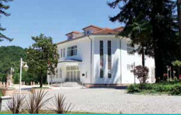
Termal Atatürk Köşkü