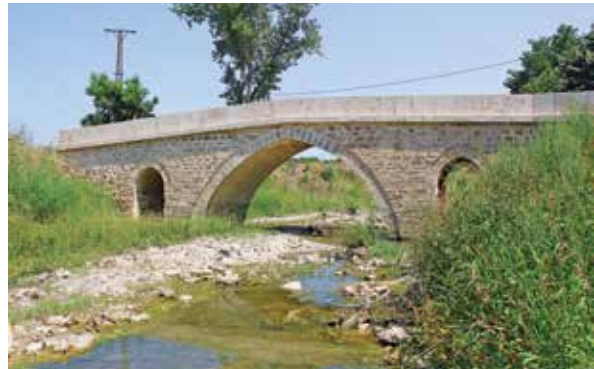
Zindan ve Su Kemerleri