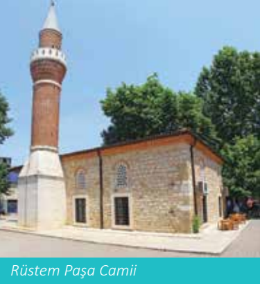
Rüstem Paşa Camii