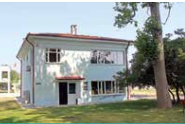
TİGEM Atatürk Köşkü ve Çocuk Müzesi

Şehir hafızasını oluşturan fotoğraflar ve bilgilerle donatılmış geçmiş yıllarda Hükümet Konağı olarak hizmet veren tarihi yapıdır. Alt kat