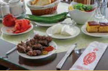
Salihli Odun Köftesi