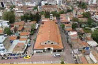
Rum Mehmet Paşa Bedesteni

tarafından, İstanbul'da yaptırılmış cami ve medreseye vakıf olarak inşa ettirilmiştir. 15.yüzyılda yapılan dik-dörtgen planlı ve tek katlı bedestenin dört yönde birer girişi bulunmaktadır.