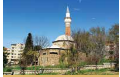
İvaz Paşa Camii