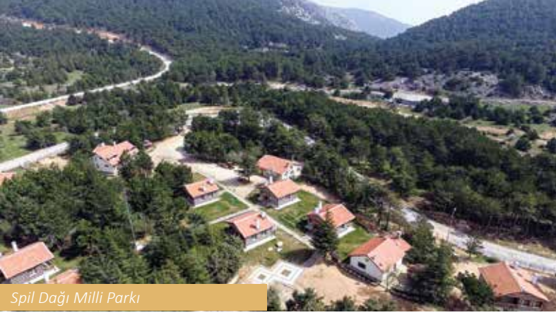
Spil Dağı Milli Parkı

caları görünümü doğa oluşumları görülür. Gediz Vadisi içinde, pastel tonlarda görkemli bir peyzaj oluşturan peribacalarına Kula - Ankara yolu üzerinde bulunan Gediz Köprüsünden sapılan bir yolla ulaşılır. İlçeye uzaklığı 18 km'dir. Kula yöresinde volkanik etkinlikler dördüncü zamanın başlarına kadar sürmüş ve genç volkanlar oluşmuştur. Sönmüş küçük volkanların bulunduğu bu alanda, çeşitli dönemlerde püskürmeler olmuş ve lav akıntıları çevreye yayılmıştır. Bu özelliğinden tarihte Kula ve çevresine Yanık Ülke (Katakekaumene) denilmiştir. İzmir - Ankara yolu üzerinden de izlenebilen volkanik tepelerin en büyükleri Sandal ve Kara Divlit'tir.