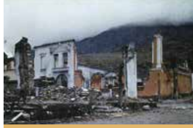
Yangın Sonrası Manisa Genel Görünüm