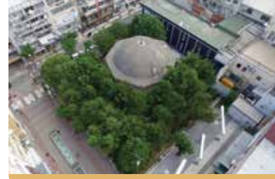
Yirmi İki Sultanlar Türbesi

Sekizgen planlı, kesme taştan yapılmış, tek kubbe ile örtülü bir bina- dır. 15.yüzyıl sonlarında, Manisa'da