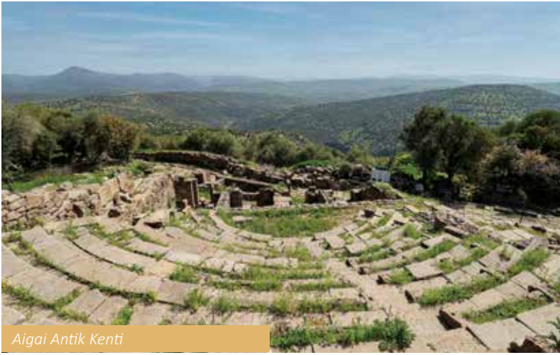
Aigai Antik Kenti

ması bakımından askeri ve ticari açıdan da önemliydi. Hristiyanlığın ilk çağlarına ait yedi kiliseden Thyateira Kilisesi'nin bulunduğu yer olarak da ziyaret edilen ken-