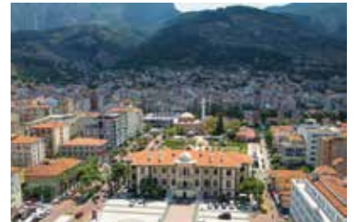
Manisa Valiliği ve Spil Dağı