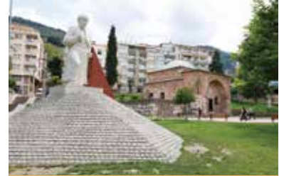
Saruhan Bey Türbesi