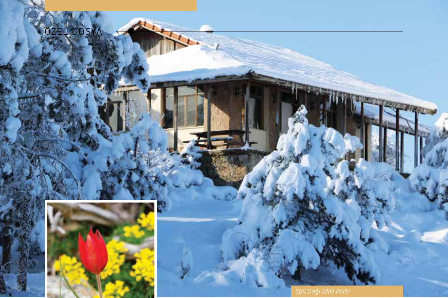
Spil Dağı Milli Parkı

tadır. Bunların arasında en ünlüsü kuşkusuz Manisa Lalesi'dir. "Manisa Lalesi, Anemon türlerine (ranunculaceae) verilen genel bir ad. Çok yıllık, parçalı yapraklı, büyük çiçekli ve otsu bitkilerdir". Spil Dağı'nda Kaya Kabartması, Frig özellikleri gösteren Lidya kültürünün kalıntıları olan kaya mezarları, Yarıkkaya'nın yakınında her biri kayaya oyulmuş evler ve bir taht görülmektedir.