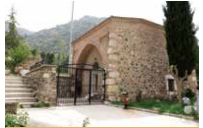
Yedi Kızlar Türbesi

Karaköy semtinde yer alan türbe Gülgün Hatun tarafından yaptırılmıştır. 14. yüzyıla tarihlenen dikdörtgen planlı, tek bir kubbeyle örtülü olan türbenin sivri kemerli bir girişi vardır. Türbede bulunan yedi sanduka nedeniyle yedi kızlar adı verilen türbe aslında Saruhanoğulları'nın eşleri için yaptırılmıştır. Ön sırada bulunan üç mezardan ortada bulunanın Gülgün Hatuna ait olduğu sanılmaktadır.