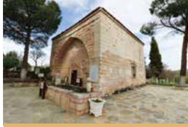
Kula Tapduk Emre ve Yunus Emre Türbesi

Güney yönündeki sivri kemer açıklıklı kare planlı giriş mekanını kırma çatı ve alaturka kiremit kaplıdır. Bu çatı içindeki küçük kubbeyi örter. Kesme taştan yapılmış ana mekan altıgen