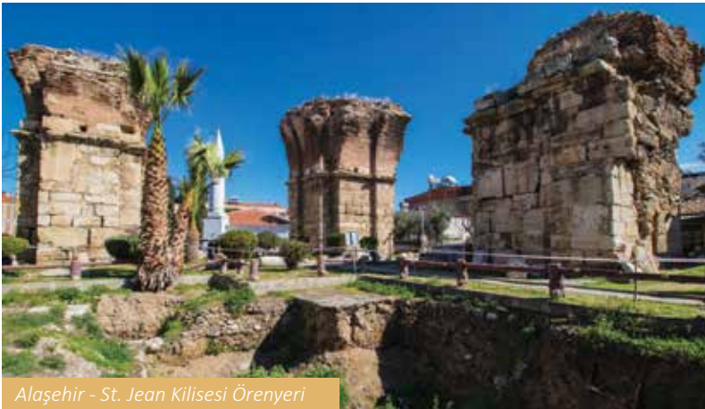
Alaşehir - St. Jean Kilisesi Örenyeri

tin Tepe Mezarlığı adıyla anılan semtin yapılan kazılarda çıkan kalıntıları görülebilir. Akhisar dinsel turizm açısından önemli bir potansiyel taşımaktadır.