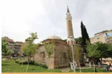
Ayn-ı Ali Camii

Spil Dağının kuzey eteklerinde 1369 yılında İshak Çelebi tarafından yaptırılmış olan Mevlevihane, projesi Mimar Emet Bin Osman'a ait bir tekkedir. Ortadaki kubbeli semahanenin güneyine sivri tonozlu geniş bir ana eyvan eklenip tekkenin mescit kısmı oluşturulmuştur. Giriş eyvanında iki katlı bir düzen uygulanmış üst kat musiki icra yeri olarak kullanılmıştır. Yapılışından bu yana birçok onarım geçirmiştir.