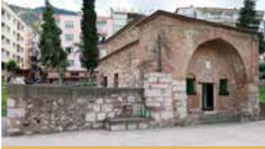
Saruhan Bey Türbesi