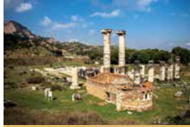
Sardes Artemis Tapınağı

Yedi Kiliseler adıyla anılan, Ege Bölgesi’ndeki yedi kiliseden üçü Sardes, Thyateira ve Philadelphia Manisa’da bulunur. Bu üç kilise ve Museviliğe ait en eski ibadethanelerden biri