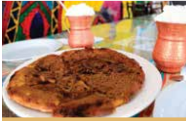
Kula Şekerli Pide