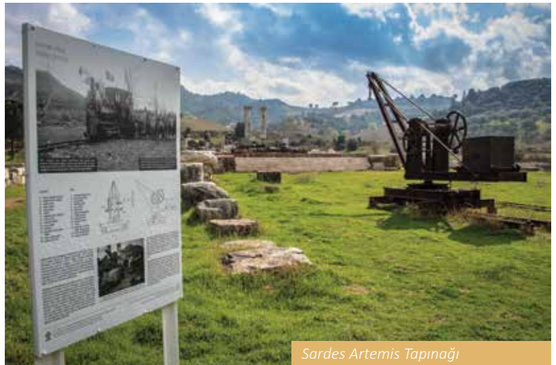
Sardes Artemis Tapınağı

Akhisar İlçesi, tarihi erken bronz çağına kadar inen antik Thyateira kentinin üzerine kurulmuştur. Antik çağda bir dokumacılık merkezi olduğu anlaşılan kent, bölgedeki yolların kesiştiği bir noktada ol-