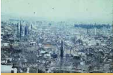
Yangın Sonrası Manisa Genel Görünüm

mutasarrıflıkların vilayet sayılması üzerine Saruhan Sancağı da vilayet kimliğini almış, 1927’de ‘Saruhan’ adı ‘Manisa’ olarak değiştirilmiştir.