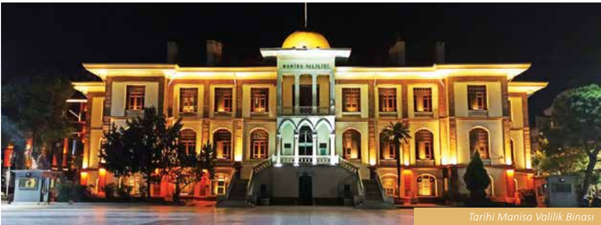
Tarihi Manisa Valilik Binası

Bugünkü eski çarşıda bulunan bedesten, Fatih Sultan Mehmet'in komutanlarından Rum Mehmet Paşa