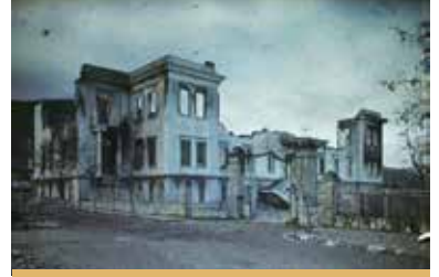
Yangın Sonrası Hükümet Konağı