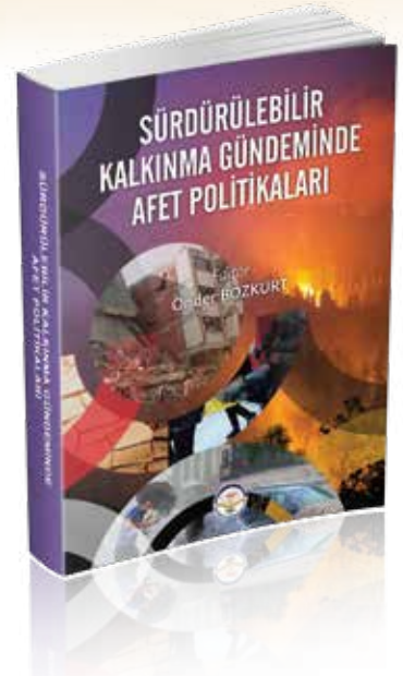
Bozkurt, Ö. (Ed.) (2022) Sürdürülebilir Kalkınma Gündeminde Afet Politikaları , Ankara: TİAV.

teknolojilerinin kullanımı, yerel afet dirençliliği, afet ve iletişim, afetlere hazırlık ve eğitim çalışmaları gibi birçok farklı konu başlığı açısından irdeleyen bu çalışmanın en temel hedefi, afet yönetimi ve kalkınma konularını yeni fikirler ile desteklemek ve bütünleşik afet yönetiminde risk odaklı bir yaklaşımın yerleşmesine katkı sağlamaktır.