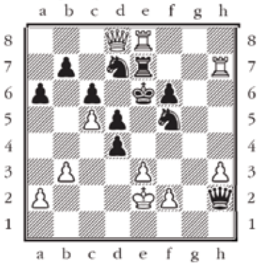
B. Damjanovic (2579) – D. Solak (2596) Prva liga Srbije 2008 Subotica, 2008

wKg2,Od8,Rc8,b7,Pc2,b1,c1,c2,b3,Nb6,Qc2,Nf7,Bc7,Pb6,b7,c6,c6,b6 Siyah oynar ve kazanır.