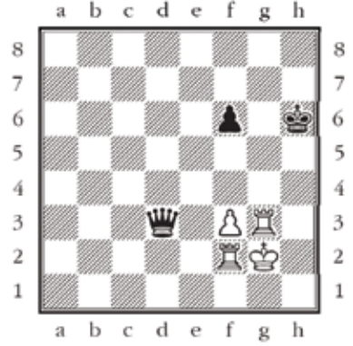
D. Solak (2595) – S. Karjakin (2730) 38. Olympiad Dresden Ger, 2009

wKg2,Rc2,g3,Pc3,Nb6,Qc3,Pb6 Beyaz oynar ve kazanır.