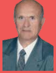
Erdi BATUR E. Vali

Kuruluşundan itibaren fetihler sonucu gelişme devri yaşayan Osmanlı Devleti üç kıtada olan hakimiyeti Sultan III. Murat zamanında 19.902.000 km 2 yüz ölçümüne ulaşmış imparatorluk idi. Devrinde bu kadar geniş alana hükmeden devlet yoktu. Askeri yönden güçlü olan devletin, nasıl olur da teknolojik ve sanayi devrimini yakalayamaması insanı azap verecek derecede üzmektedir. Devletin eyaleti büyüklüğünde bulunan devletler bu atılımı yapıyor da Osmanlı bunu yapamıyor, insanın aklına sığmıyor.