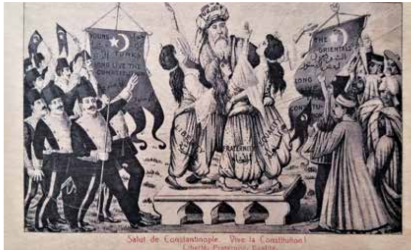
KP 136 "Yaşasın Meşrutiyet. Hürriyet, Uhuvet ve Müsavat", Garpcılar ve İslâmcılar birlikte Meşrutiyet'e sahip çıkıyorlar.

1854 Kırım Savaşında başlayan borçlanma politikasının yarattığı ekonomik bozukluk, 1875-76 yıllarında Devletin karşılaştığı siyasi sorunlar, inanmış bir meşrutiyetçi Mithat Paşa ve arkadaşlarını harekete geçirdi. Düşün yapısını ortaya koyan Genç