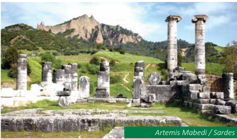
Artemis Mabedi / Sardes