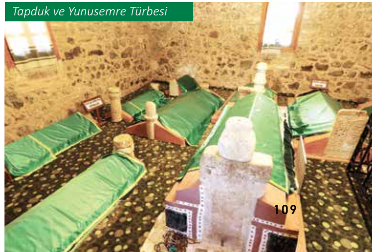
Tapduk ve Yunusemre Türbesi