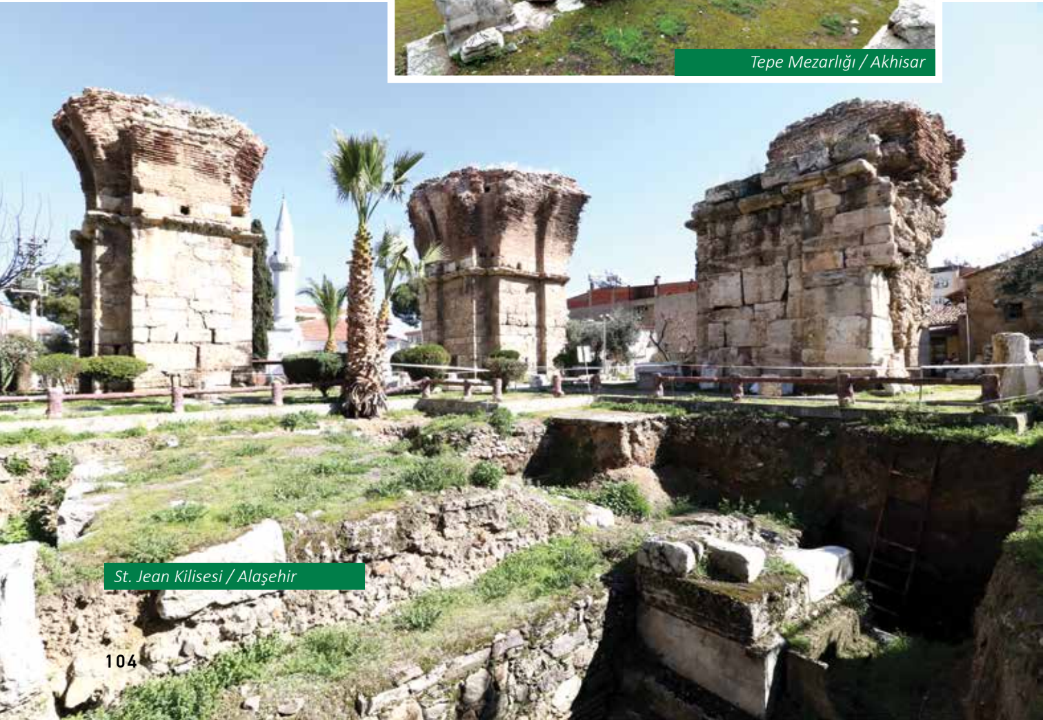
St. Jean Kilisesi / Alaşehir