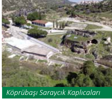
Köprübaşı Saraycık Kaplıcaları