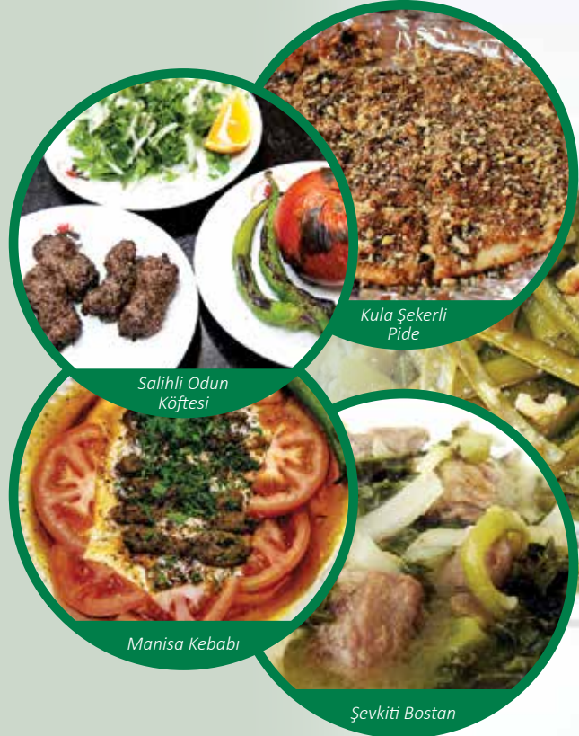
Salihli Odun Köftesi

Manisa'nın üzümünden de çeşitli biçimde yararlanılmaktadır. Pekmez, şıra, günbalı, tava balı, ekşi bulama, şerbet, hoşaf bağ kültürünün ürünleri arasındadır. Sebze - meyve kurutma, erişte, salça, reçel, tarhana yapımı, kırsal kesimde çok yaygındır.