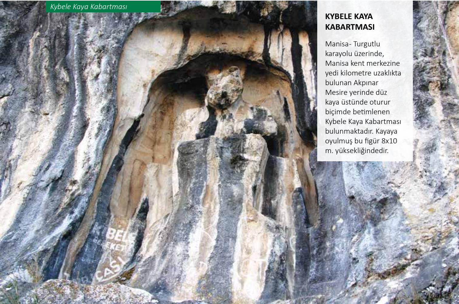
Kybele Kaya Kabartması

Manisa Kent Merkezinde Karaköy Semtindeki Çaybaşı denilen alanda, Spil Dağının kente en yakın eteğinde bulunmaktadır. Niobe Doğal Anıtı yörede “Niobe Kayası” ve “Ağlayan Kaya” adıyla da anılmaktadır. Niobe Kayası; doğal aşınma sonucunda göz yerleri oyulmuş, yüzü pürtük pürtük kapkara kesilmiş, dalgalı saçları toprağa düşmüş ağlayan bir kadını andırır. Niobe’den ilk söz eden Homeros’tur. “İlyada” destanında dramatik öyküsünü anlatır.