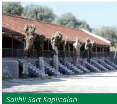
Salihli Sart Kaplıcaları