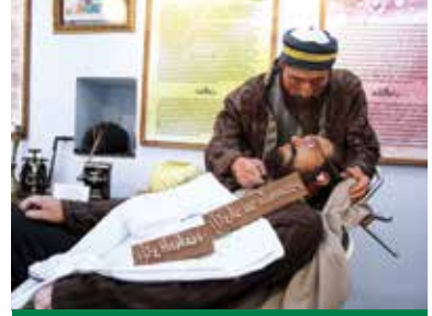
Tıp Tarihi Müzesi