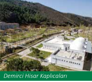
Demirci Hisar Kaplıcaları