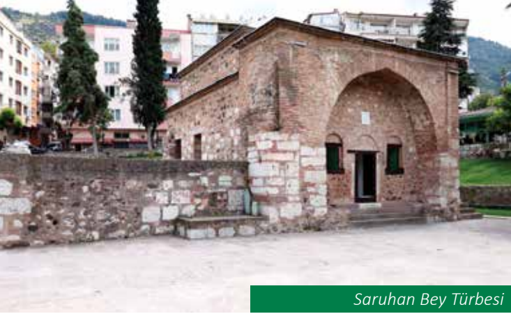
Saruhan Bey Türbesi