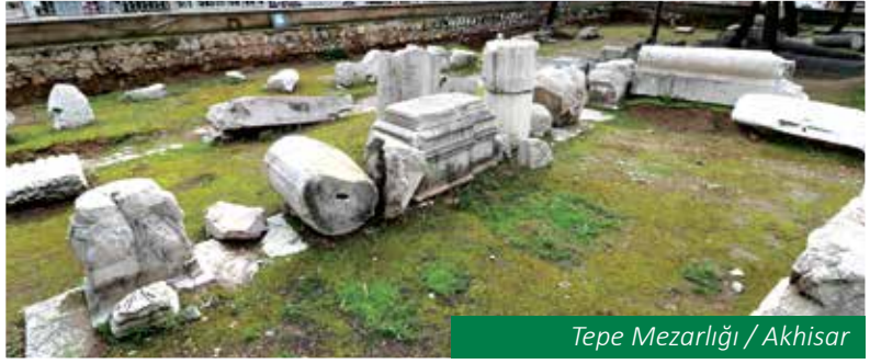
Tepe Mezarlığı / Akhisar

dern yerleşmenin altında kalmıştır. Pergamon krallarından II. Attalos Philadelphos tarafından kurulan Philadelphia, Roma döneminde, tapınaklarının ve kentte yapılan festivallerin çokluğundan dolayı "Küçük Atina" diye anılmıştır. Bizans döneminde önemini koruyan kent, bu dönemde sağlam bir surla çevrilmiştir. Kentin en görkemli anıtlarından birisi de, sadece üç payesi korunmuş olan Aziz Jean Kilisesi'dir. 6. yüzyılda yapılmış olan bazilika, sonraki dönemlerde de onarımlar geçirmiştir. Bu kilisenin de incil'de adı geçen 7 kiliseden birisi olduğu bilinmektedir.