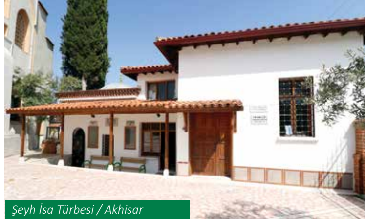
Şeyh İsa Türbesi / Akhisar