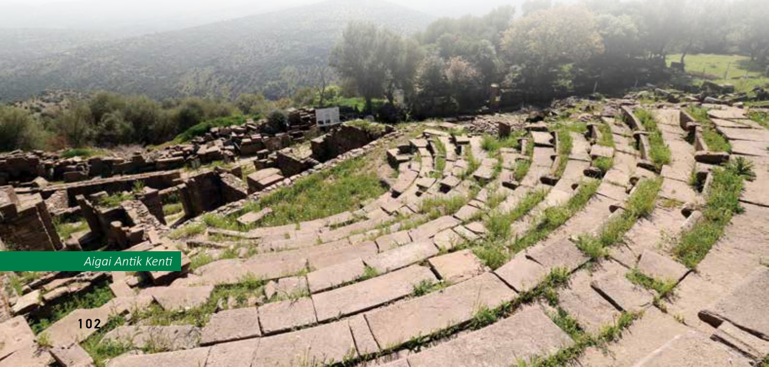
Aigai Antik Kenti

karanlık ve acı günlerini yaşamıştır. Kurtuluş Savaşı'nda kaçan düşman tarafından ateşe verilen yerleşimlerden biri olmuştur. 8 Eylül 1922'de kurtarıldığında kent adeta bir "yangın yeri" görünümündeydi. Bu arada Alaşehir, Salihli, Ahmetli ve Turgutlu ilçe merkezleriyle yakın köylerin de yakılıp yıkıldığını belirtmeliyiz. Cumhuriyet ile birlikte, Manisa da yeni tarihi süreçteki yerini almıştır. 1923 yılında bütün mutasarrıflıkların vilayet sayılması üzerine Saruhan Sancağı da vilayet kimliğini almış, 1927'de 'Saruhan' adı 'Manisa' olarak değiştirilmiştir.