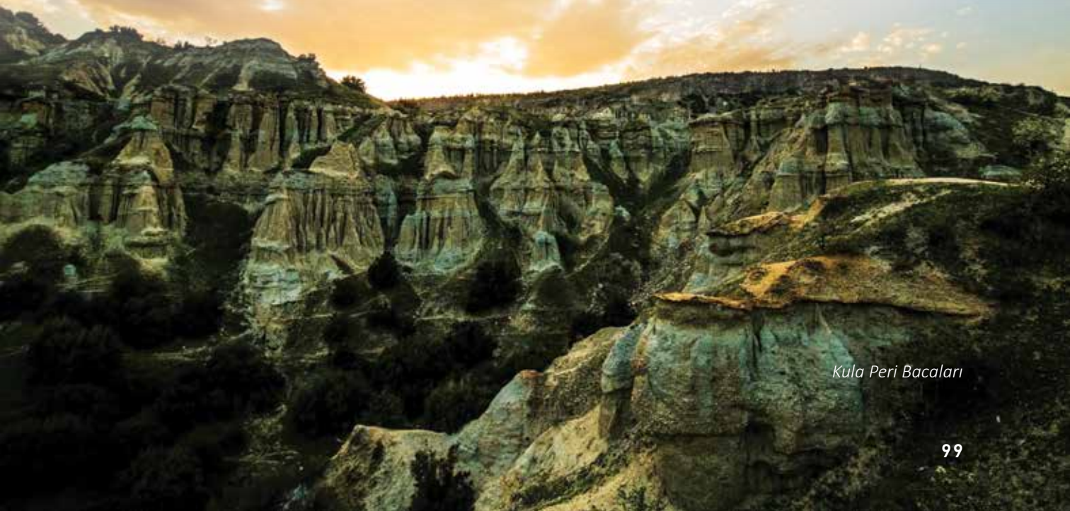
Kula Peri Bacaları

nulmuş bir ildir. 19. yüzyıl sonlarında Soma ilçemizde başlayan linyit madenciliği, çok büyük gelişmeler göstererek bugün yıllık 10.000.000 ton düzeyinde yüksek ısı değerine sahip linyit kömürü üretim düzeyine ulaşmıştır. Perlit, zeolit, nikel, uranyum maden rezerv varlığı yönünden ülkemizin en önemli ilidir. Yine ülkemizin ilk ve tek konsantre nikel üretim tesisi Gördes ilçemizde kurulmuş ve üretime başlamıştır. Bu tesis ile daha önce ithalat yoluyla karşılanan nikel tamamen yerli üretimle karşılanacaktır.