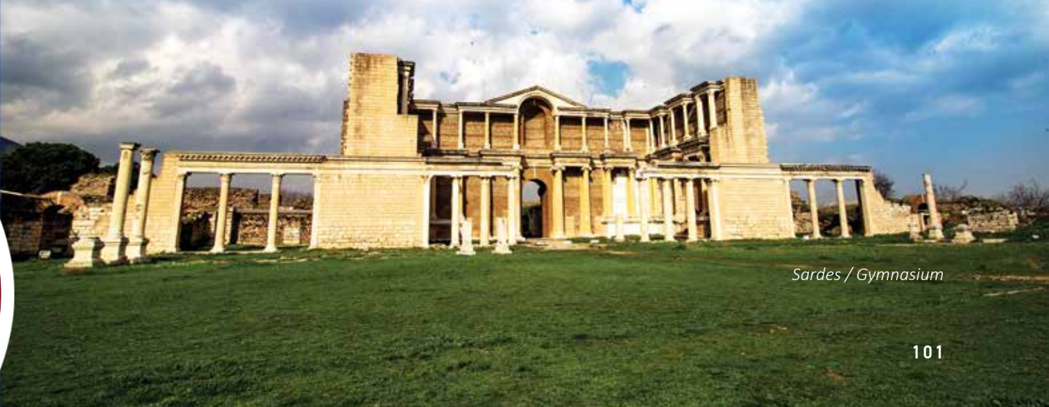
Sardes / Gymnasium

kadar bozulmadan gelen Kula'daki bir anıt kent, Kurşunlu'da kaplıcaları ile şifanın adresi, organize sanayi bölgesi ile en iyi yatırım merkezidir. Yılkı atlarının özgürlük şarkıları eşliğinde trekking, dağcılık ve yamaç paraşütüne davetiyedir. Her geçen gün büyüyüp kendisini yenilerken, Türkiye'nin yükselen değeri, eski ve yeninin uyumlu birlikteliğinin en güzel sunumudur. Manisa, geçmişinin ışığından taşıdığı izler ve doğal güzellikleriyle farklı turizm seçeneklerini aynı anda gerçekleştirme şansına sahip olabileceğiniz Ege'nin eşsiz kentlerinden biridir.