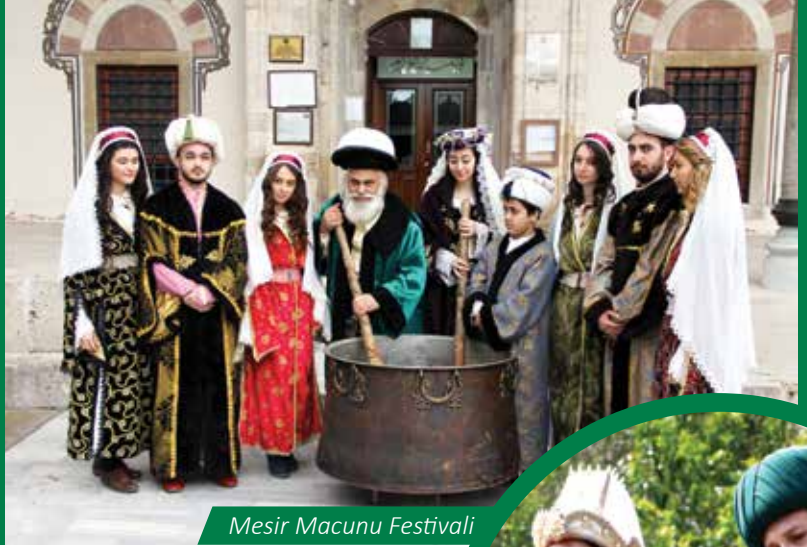
Mesir Macunu Festivali

“Şehzadeler Şehri” olarak bilinen Manisa’nın kültür tarihiyle az çok ilgilenenlerin karşısına, bereketli Gediz ovası ve efsanevi Spil Dağı çıkar. Kentsel Coğrafyayı belirleyen bu iki doğal varlıktan ne zaman söz edilse önce ‘Sultaniye Üzüümü’ ve ‘Manisa Lâlesi’ anımsanır. Manisa ve yakın çevresindeki değerler salt bunlarla sınırlı değil elbet. Kybele Rölyefi, Pelops Tahtı, Sandikkale, Ulucami, Mevlevihane, Muradiye, Sultan, Hatuniye külliyesi Çaybaşı’nı çevreleyen tarihsel doku, diğer anıtsal yapılar, Yoğurtçu Kale, Aigai ören yeri, bilim-kültür – sanat ürünlerinin sergilendiği Manisa Müzesi, kültürel mirasın göz kamaştırıcı örnekleri arasında yer almaktadır. Bunların yanında, Gediz ırmağı kıyısında orta-