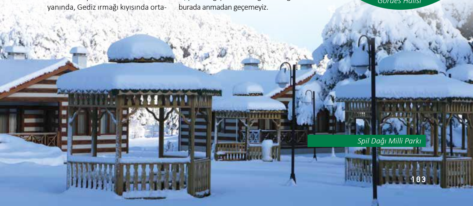
Spil Dağı Milli Parkı