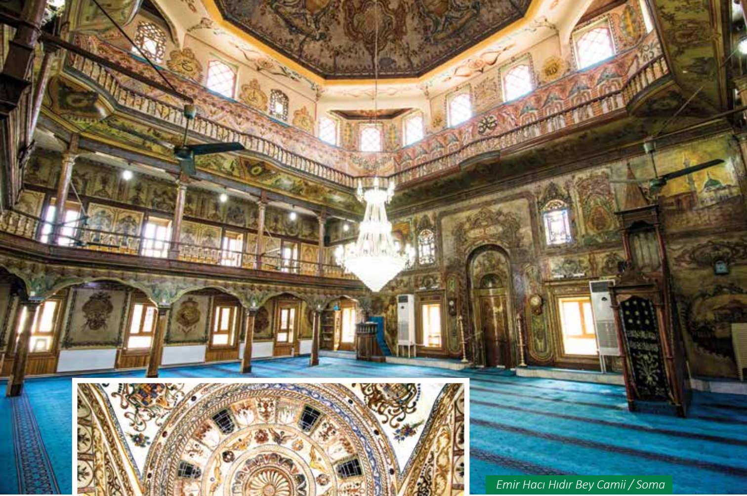
Emir Hacı Hıdır Bey Camii / Soma