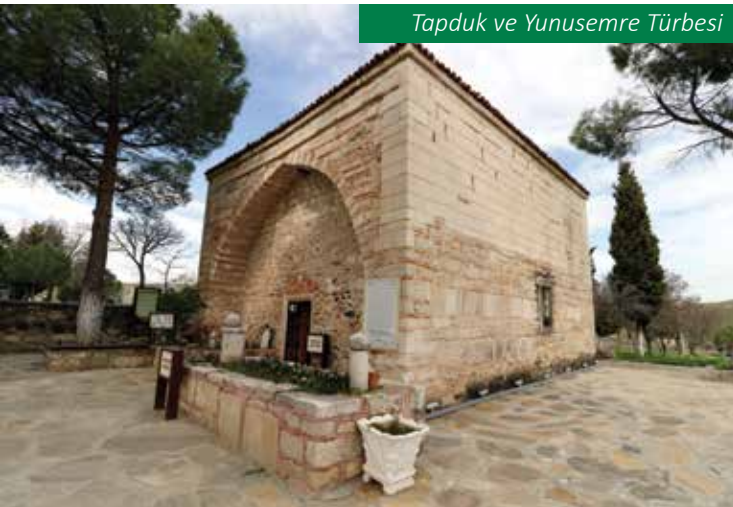
Tapduk ve Yunusemre Türbesi