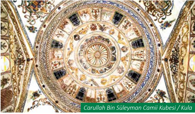
Carullah Bin Süleyman Camii Kubesi / Kula