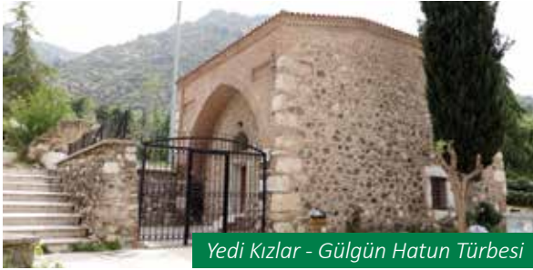
Yedi Kızlar - Gülgün Hatun Türbesi

Kula'ya bağlı Emre Köyünde H.954 yılına tarihlenen bir çeşme, iki hamam kalıntısı ve medrese temeli günümüze kadar ulaşabilmiştir. Türbe içinde ortadaki Tapduk Emre'ye diğerleri ise aile fertlerine ait olduğu söylenen on mezar bulunmaktadır. Türbe kapısının hemen önünde, taşında balta tasviri bulunan mezarın ise Yunus Emre'ye ait olduğuna inanılmakta ve her yıl binlerce kişi tarafından ziyaret edilmektedir.