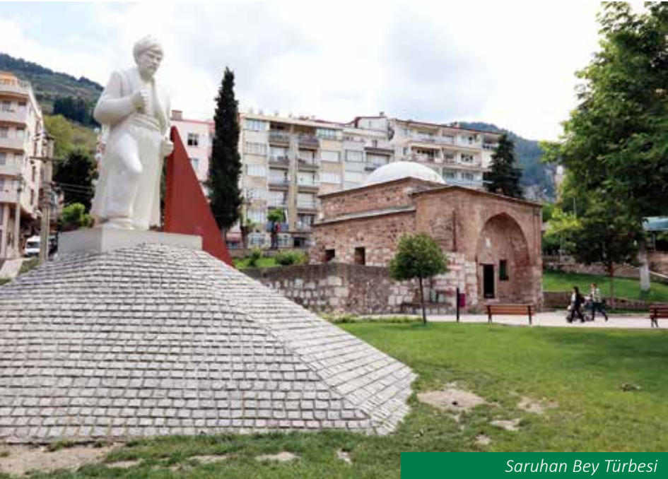
Saruhan Bey Türbesi

1410 yılında Çelebi Mehmet tarafından Osmanlı Devleti'ne katılan Manisa, Saruhan Sancağı adıyla idari birim haline getirilmiştir. 1410-1595 yılları arasındaki 185 yıl boyunca 'Saruhan Tahtı' olarak adlandırılan Manisa, çok canlı bir bilim kültür sanat şehri olarak tanınmıştır. 16 Şehzade, Manisa'da sancakbeyliği yaparak devlet yönetimi tecrübesi kazanmıştır. Bunlardan Fatih Sultan Mehmet, Kanuni Sultan Süleyman, II. Selim, III. Murat ve III. Mehmet Padişahlık yapmışlardır. Sultan I.