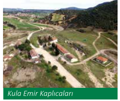
Kula Emir Kaplıcaları

Manisa; Salihli Kurşunlu, Sart, Turgutlu Urganlı, Kula Emir, Demirci Saraycık, Hisar, Soma Menteşe Kaplıcaları ve Alaşehir, Salihli, Kula maden suları ile şifalı sular bakımından zengindir. Yörede bulunan su kaynakları yöre halkı tarafından asırlardır bilinen ve kullanılan kaynaklardır. Bazılarının yakınlarında bulunan hamam kalıntılarından, bunların antik dönemden beri kullanıldığı anlaşılmaktadır. Sıcaklık dereceleri, banyo ve içmece olarak kullanılmaya özellikleri, tesisleşme ve kalitesi ile Manisa Termal Merkezleri şifası ile tercihe sebep değerlerdir.