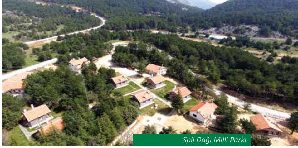
Spil Dağı Milli Parkı

Kula ve çevresi, volkanik özellikli jeolojik yapıya sahiptir. Kula yöresinde volkanik etkinlikler dördüncü zamanın başlarına kadar sürmüştür ve genç