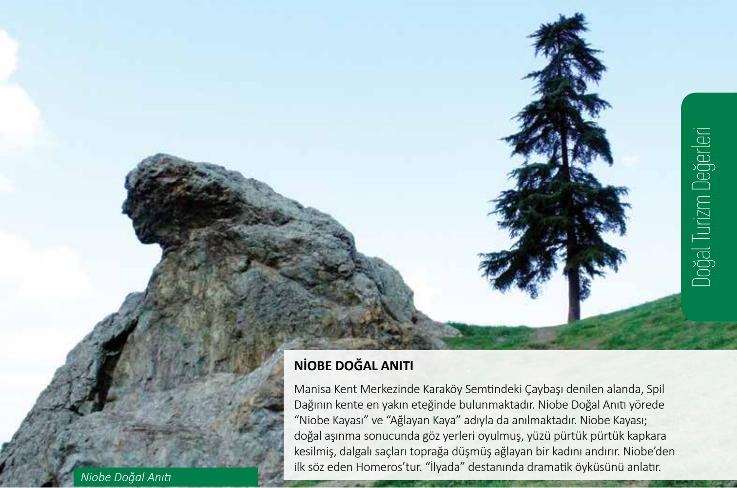
Niobe Doğal Anıtı