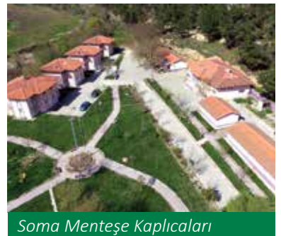
Soma Menteşe Kaplıcaları