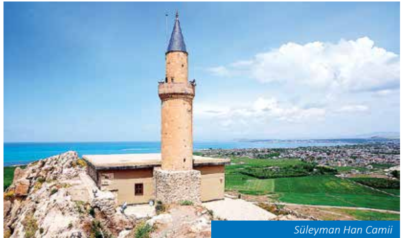
Süleyman Han Camii

Van Kalesi'nin zirvesindeki Süleyman Han Camii, Kanuni Sultan Süleyman'ın İrakeyn Seferi sırasında