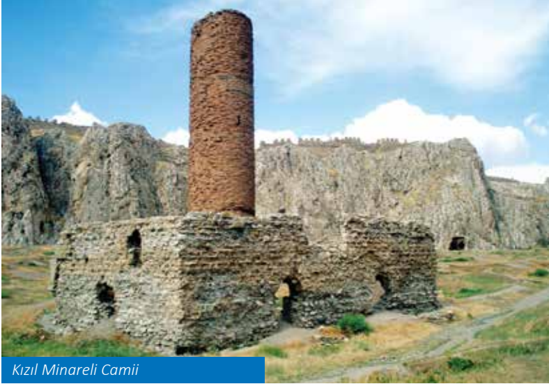
Kızıl Minareli Camii

caminin esaslı onarımı mimar Sinan tarafından yapılmıştır. Evliya Çelebi Seyahatnamesi'nde caminin üzerinin kubbe ile örtülü olduğunu belirtmiştir. Depremlerde ve savaşlarda yıkılan cami, 95 yıl sonra 17 Eylül 2010'da restore edilerek ibadete açılmıştır.