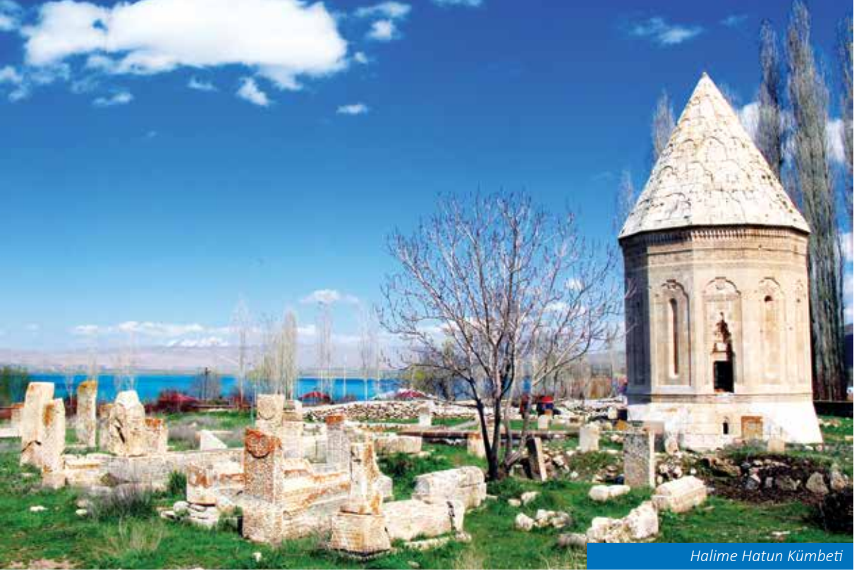
Halime Hatun Kümbeti