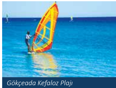
Gökçeada Kefalöz Plajı

Yıldızkoy'da Deniz florası ve faunası koruma altında olan bölgede şnor-kelle yüzerek zengin sualtını seyretmek size ayrı bir zevk sunacaktır.