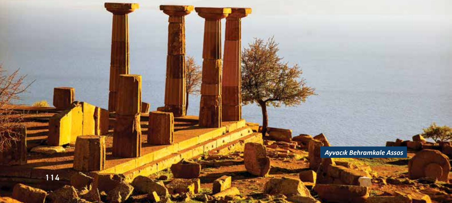
Ayvacık Behramkale Assos

Kent içerisinde büyük bölümü toprak ve bitki örtüsüyle kaplı olan ve denize doğru uzanan bir tiyatro, tiyatronun hemen güneydoğusunda temelleri görülen ve MÖ.3yüzyıla tarihlenen Tapınak yer almaktadır. Nymphaion'u (Anıtsal çeşme), Forum'u (Ticaret meydanı), Podyumlu Tapınağı, Odeon'u (Küçük Tiyatro)