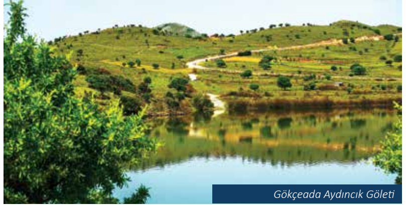
Gökçeada Aydıncık Göleti

Doğa sporları severler için adada bulunmaz fırsatlardan birisi de Dereköy yakınlarındaki Marmaros Şe-