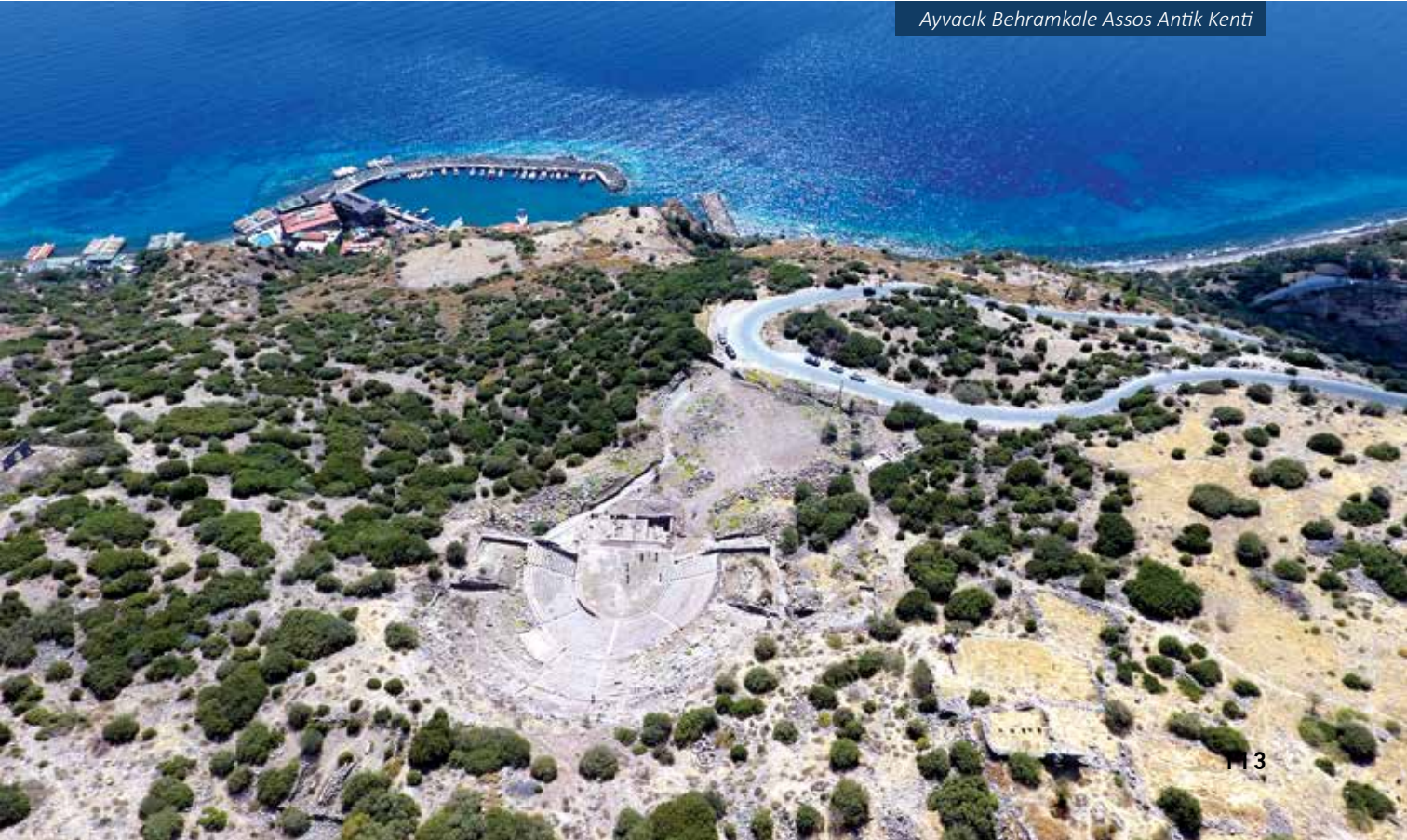
Ayvacık Behramkale Assos Antik Kenti

Agora siyasi ve ticari hayatın buluşma noktasıdır ve Ege denizine bakan en sarp alanda inşa edilmiştir. Agoranın kuzey ve güneyinde çok katlı stoalar, doğusunda ise bouleterion (şehir meclis binası) yer almaktadır.