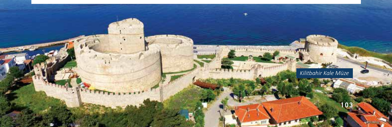
Kilitbahir Kale Müze

Savaşları Gelibolu Tarihi Alan Başkanlığı idari binasının sınırlarında içinde yer alan Çamburnu Kalesi de bulunmaktadır. Tarih boyunca çeşitli kültürlerle ev sahipliği yapan Çanakkale şehri ve boğazı bu kaleler sayesinde jeopolitik önemini sürekli korumuştur.