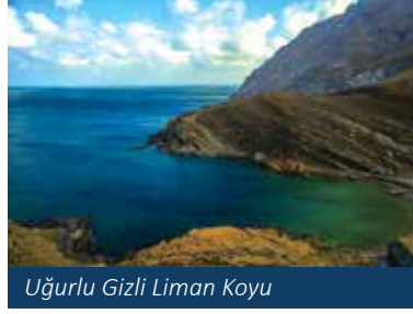
Uğurlu Gizli Liman Koyu