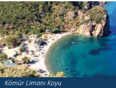
Kömür Limanı Koyu

Saros Körfezi'nde, hiçbir yapılaşmanın olmadığı en bakir koy Kömür Limanı, her yaz su altı tutkunlarını ağırlıyor. Benekli deniz tavşanları dalgıçların koya gelmelerinin baş nedeni. Limanda, denizle ormanın kucaklaştığı doğa harikası bir koy, akvaryum gibi berrak bir deniz ve harika bir manzara sizleri karşılıyor. Ayrıca, dağlardan gelen buz gibi doğal kaynak suları sahile kadar iniyor. Limana inmeden önce yukarıdan kayalıkları, denizdeki büyük balıkları çıplak gözle seyredebilirsiniz.