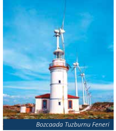
Bozcaada Tuzburnu Feneri

Bozcaada'nın neredeyse her yerinden görülebilen bir çan kulesi bulunan, Rum Ortodoks Cemaatine ait Meryemana Kilisesi Rum mahallesi-nin tam ortasında yer almaktadır ve ibadete açıktır.