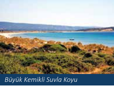
Büyük Kemikli Suvla Koyu