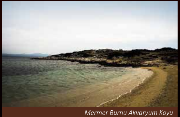
Mermer Burnu Akvaryum Koyu