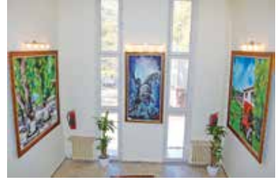
Tefenni'nin Değerlerinden Tuvale Yansıyanlar

İşması” tamamlanarak süresiz bir şekilde Hükümet Konağımızda geniş bir katlımla açılışı yapılarak sergilenmiştir. Resim öğretmenlerimizin ilk sergisi olmasına rağmen fırsat verilince ne denli başarılı çalışmalar ortaya konulabileceği özellikle kendileri tarafından açıkça görülmüştür.