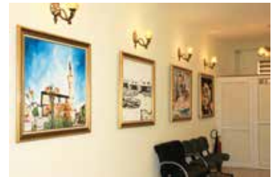
Tefenni'nin Değerlerinden Tuvale Yansyanlar