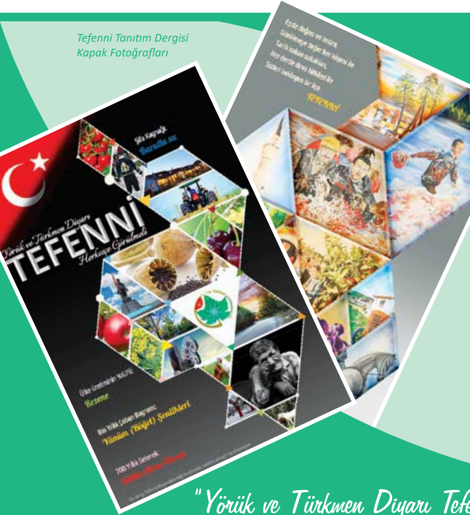
Tefenni Tanıtım Dergisi Kapak Fotoğrafları

Ekip çalışması neticesinde ortaya konulan tüm bu çalışmalar cennet yurt kösemiz olan Tefenni’yi siz değerli okuyuculara tanıtmak olup, bu yazımızı da İlçemize davet niteliğinde kabul buyurulmasını temenni ederiz.