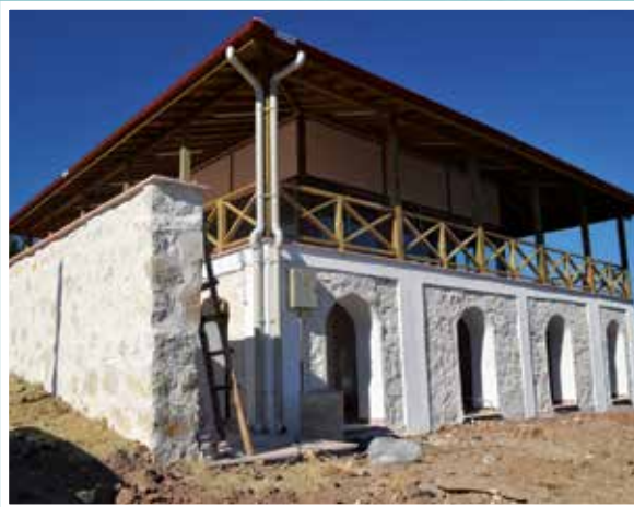
Kütahya Büyükaşlıhanlar Şehitliği