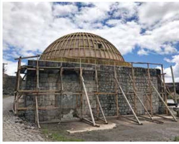
Kars Muradiye Hamamı