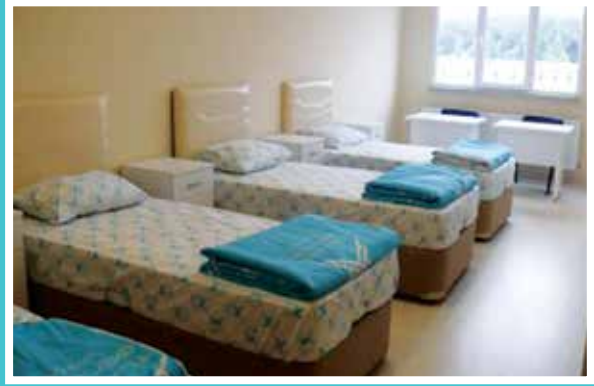
Amasya Öğrenci Yurdu