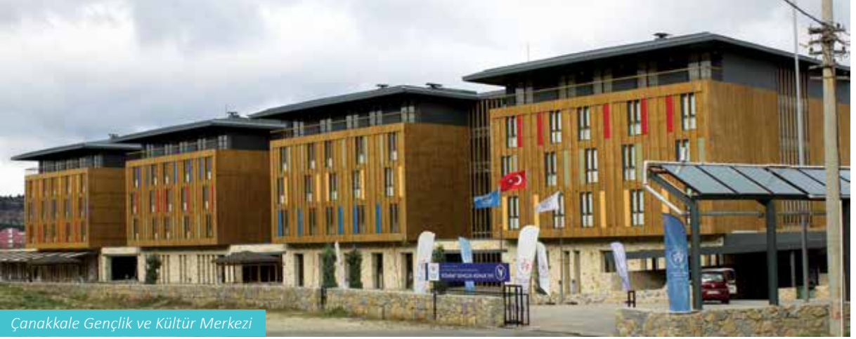
Çanakkale Gençlik ve Kültür Merkezi

3 vali ve 3 il genel meclis üyesi olmak üzere 7 asil üyeden oluşmaktadır. Encümen seçimleri, dönem başı toplantısı olan Mayıs ayında yapılır.