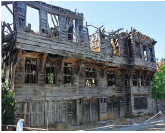
Akçakoca Konak Eski Hali