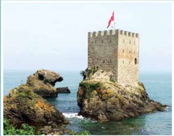
Rize Kız Kalesi