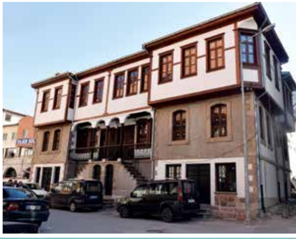
Afyon - Sinan Paşa