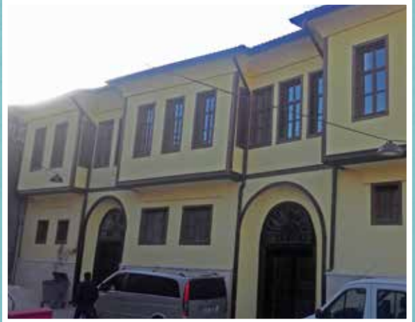
Germiyan Beylik Konağı