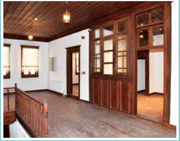
Afyon - Sinan Paşa