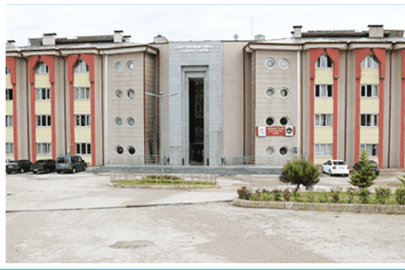
Kocaeli Öğrenci Yurdu