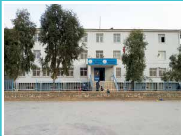
Mardin Nusaybin Okul