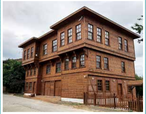
Akçakoca Konak Yeni Hali