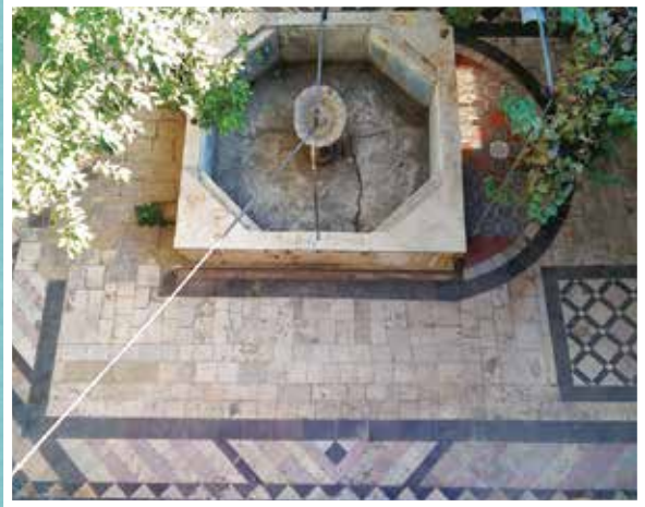
Kilis Canpolat Konak