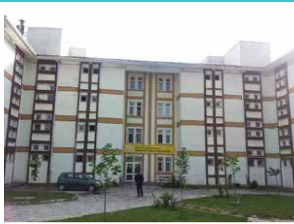
Gümüşhacıköy Öğrenci Yurdu