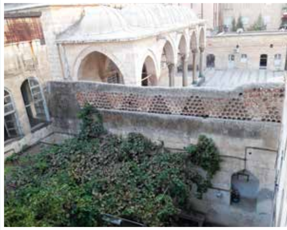
Kilis Canpolat Konak