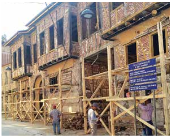
Germiyan Beylik Konağı