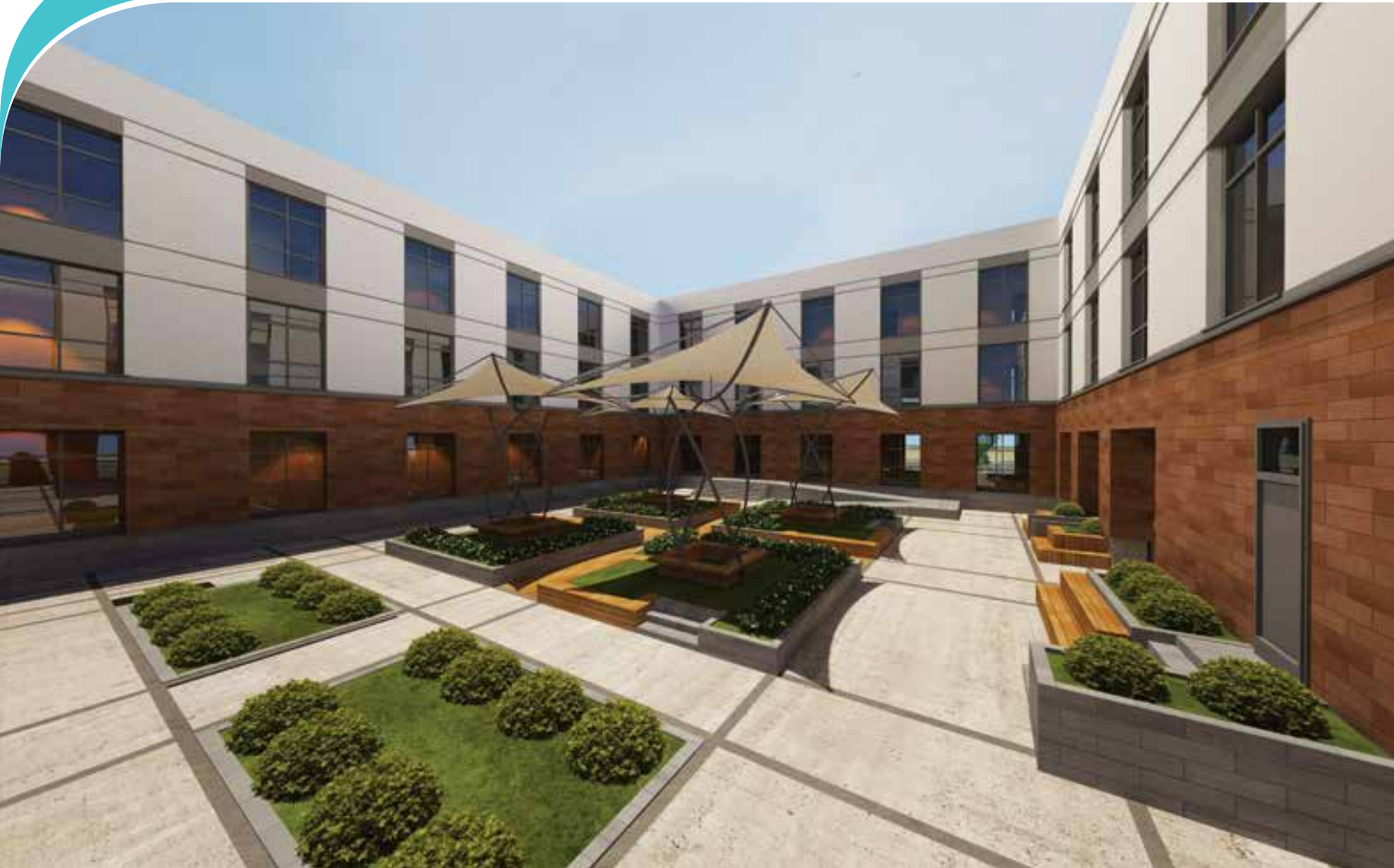
Ahlat Gençlik Merkezi