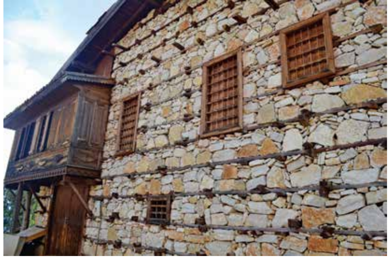
Şekil 3. Yöreye özgü duvar tekniği.