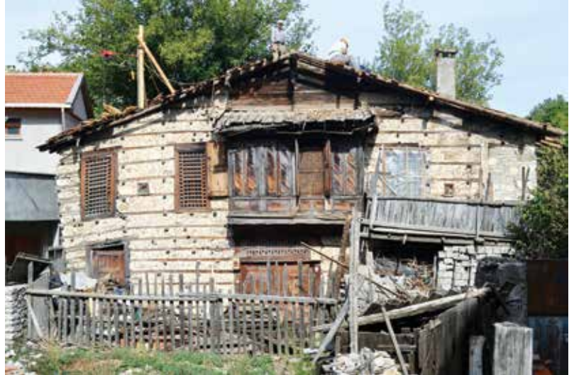
Şekil 4. Yaklaşık olarak üç yüz yıldır içinde yaşamın devam ettiği bir ‘düğmeli ev’in görünümü.