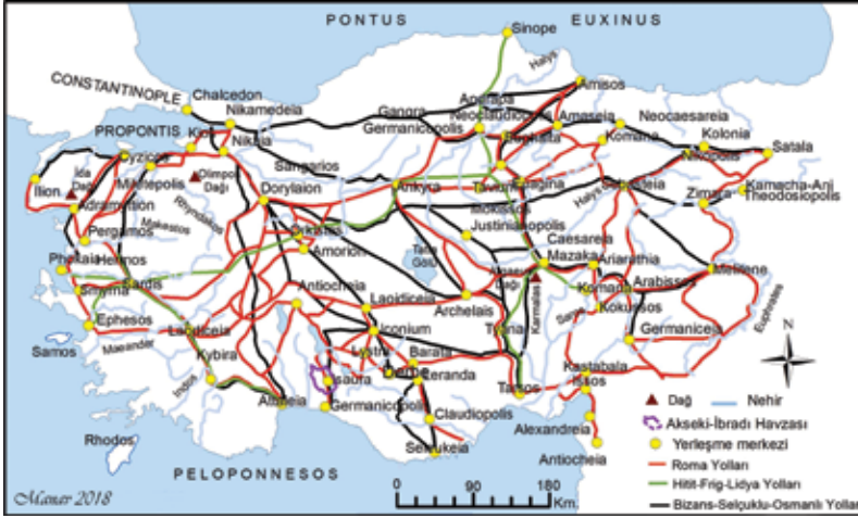
Şekil 1. Anadolu'nun tarihi yolları haritası.