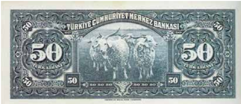
1947 yılında çıkarılmış ve 1961 yılına kadar tedavülde kalan 50 Türk Lirası

En kaliteli tiftik bir yaşındaki çepişlerin tiftiğidir. Bunlar yumuşak ve ince tüylüdür. Gezdan ve seyislerin tiftiği orta kalitedir. Tüyleri de orta