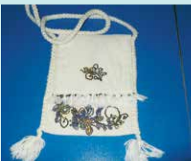
Kazan Sof Kumaş Atölyesinde Üretilen Kumaşlardan Elde Edilen Ürün Örnekleri Dokuma, tasarım, nakış ve fotoğraf Süreyya ZİLE