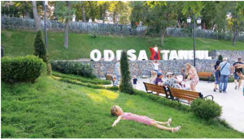
Foto 1 ve 2. İstanbul Büyükşehir Belediyesi'nin kardeş şehri Odessa (Ukrayna)'da ünlü Potemkin Merdivenleri yanındaki şehir parkı. Parkın peyzajı İstanbul BŞB'nin katkılarıyla gerçekleştirilmiştir.

bölgesindeki ülkeler ile kardeş şehir anlaşması imzalandığını ortaya koymaktadır. Türkiye'de belediyeler daha çok Avrupa ve Asya ülkeleri ile kardeş şehir ilişkisi kurmuştur. Kardeş şehir ilişkilerinde iki ülke arasında kültürel ve tarihsel bağların yanı sıra ekonomik/ticari, siyasi ilişkilerin etkili olduğu belirlenmektedir.