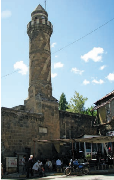
Alaaddin Bey (Paşa) Camii