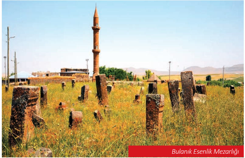
Bulanık Esenlik Mezarlığı

izleri halen kendisini göstermektedir. Ekonomisi tarım ve hayvancılığa dayalı olan Bulanık ilçesinde önemli tarihi eserler bulunmaktadır. Kazan Gölü, Elmakaya Höyüğü, Mollakent Kaya Mezarları ve Kaya Kilise, Mollakent Camii, Mollakent Asri Mezarlığı, Mollakent Şeyh İbrahim Türbesi, Esenlik Camii ve Selçuklu Mezarlığı önemli tarihi eserlerdir.